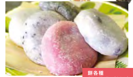
餅各種 (豆大福、草、ごまなど)

[住所]小樽市新富町13-13 (南樽市場前) [TEL]0134-22-1221 [営業時間]11:00~18:00 (水曜は15:00まで)、木曜休 ☎ 493 631 497