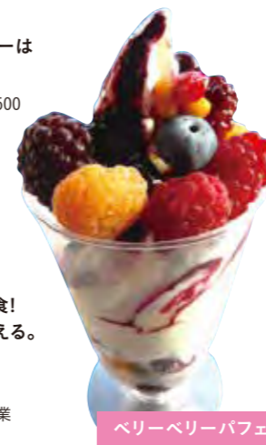
ベリーベリーパフェ

[住所]仁木町東町13-49 [TEL]0135-32-3090 [営業時間]レストラン11:00~20:00、冬期間休業 ☎ 164 575 112