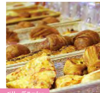
ブルーベリーデニッシュ トマトピザ