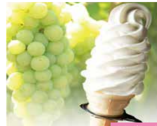
ナイアガラソフト