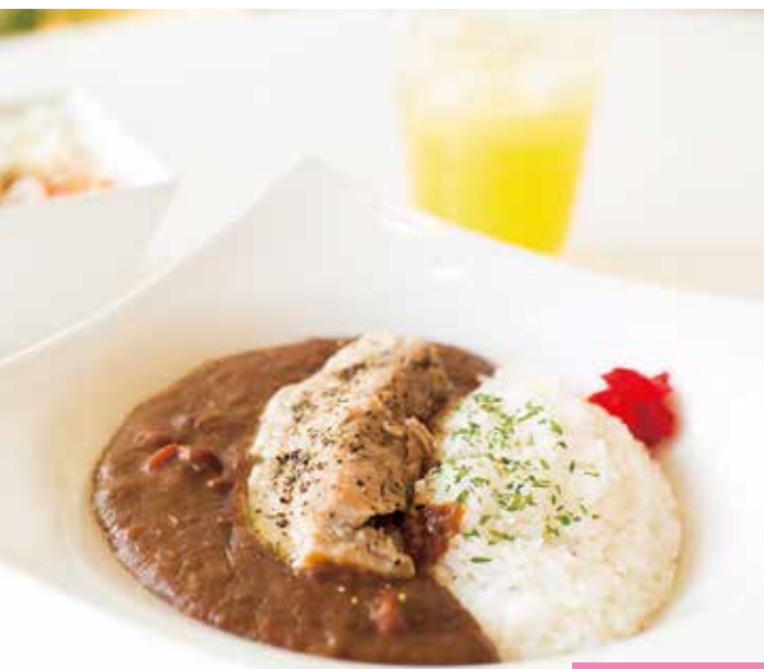
オリジナルカレー