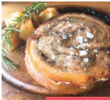
北島麦豚のボルケッタ

[住所]余市郡仁木町砥の川1183 [TEL]0135-32-2388 [営業時間]11:00~15:00、17:00~22:00、火曜休 冬期休業(12月~4月) ☎ 938 347 158