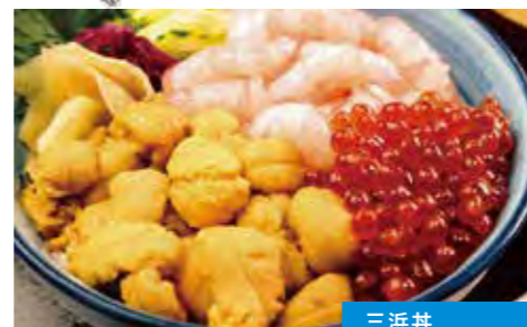
三浜丼 (ウニ・甘エビ・イクラ)