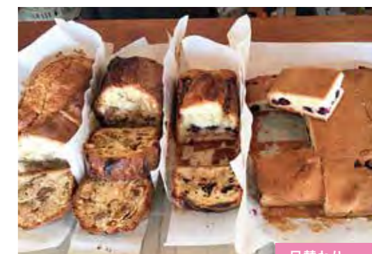
日替わり パウンドケーキ