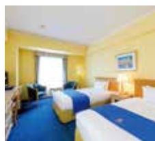
▲スタンダードツイン