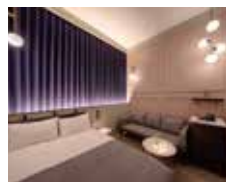
▲スタンダードダブル