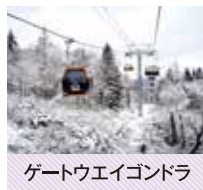
ゲートウェイゴンドラ