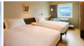
▲スーベリアツイン(定員3名)