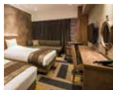
▲スーパーアツイン