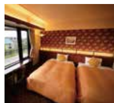
▲運河側ツイン(一例)