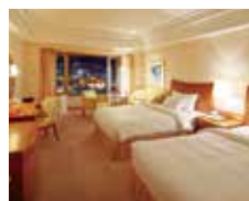
▲マウンテンビューデラックスツイン