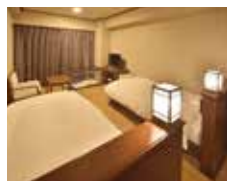
▲ツインルーム(広さ21.4㎡)