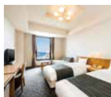
▲スーパーアツイン