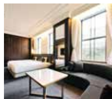
▲デラックスルーム